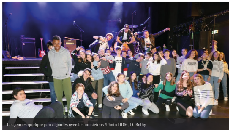
Les jeunes quelque peu déjantés avec les musiciens !