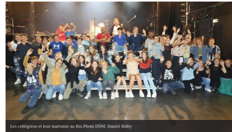
Les collégiens et leur marraine au Rio.