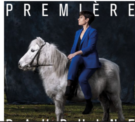
Au programme avec Première Dauphine : de la musique pop-rock indé à la française.