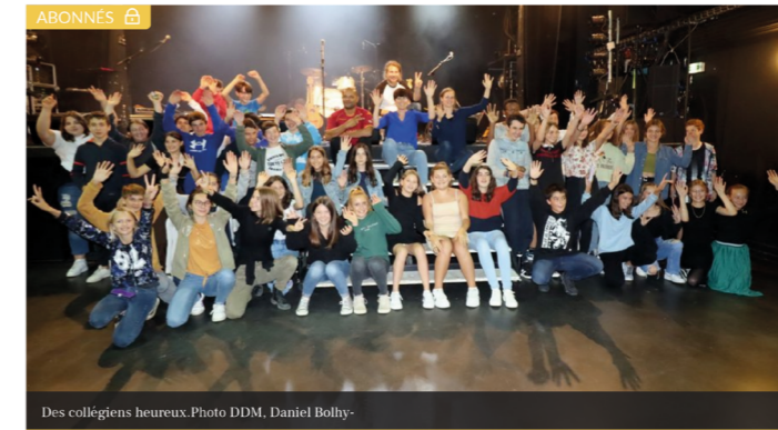
Des collégiens heureux.